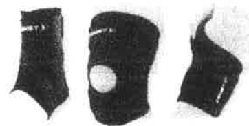
レフェリー許可の医療製品 13平方センチ1つ