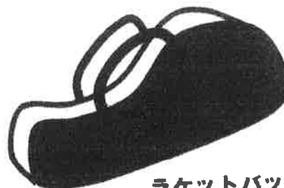
ラケットバッグ 製造業者ロゴの数と大きさに制限なし